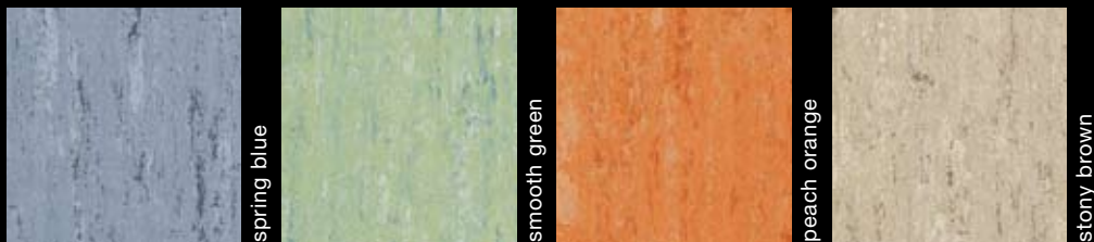
6151-020 spring blue 6151-036 smooth green 6151-072 peach orange 6151-042 stony brown