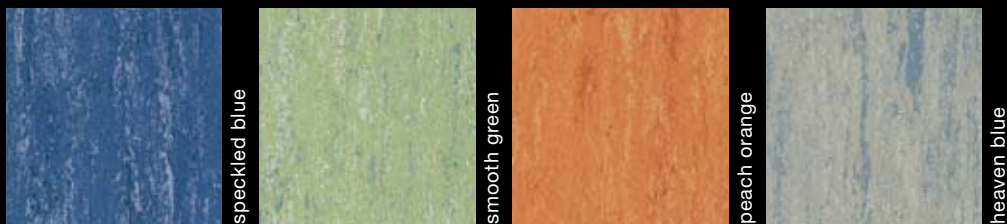
6157-024 speckled blue 6157-036 smooth green 6157-072 peach orange 6157-057 heaven blue