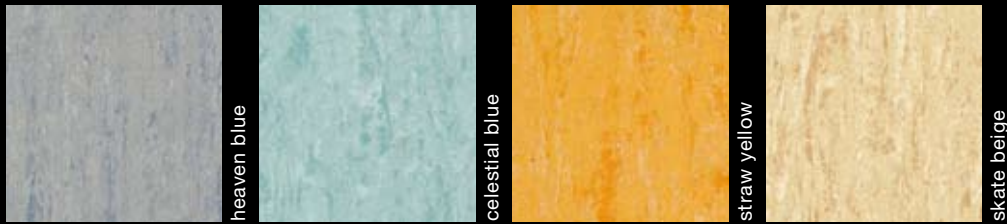
6151-057 heaven blue 6151-021 celestial blue 6151-074 straw yellow 6151-051 skate beige